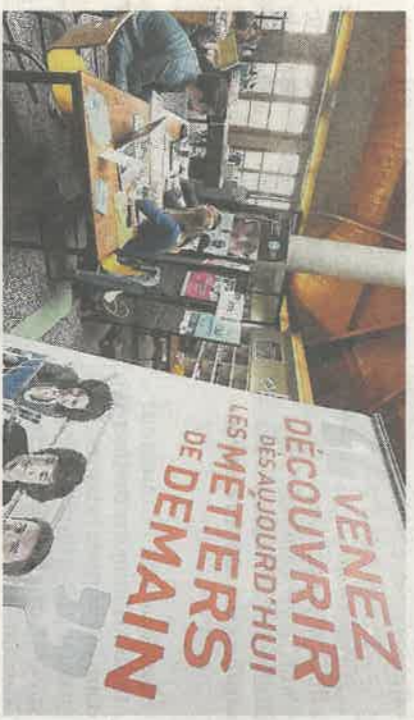
OPCO 2i est l'opérateur de compétences de toutes les industries.

Show Industrie, les 22 et 23 novembre prochains au centre des foires et congrès de l'Euro-métropole de Metz.